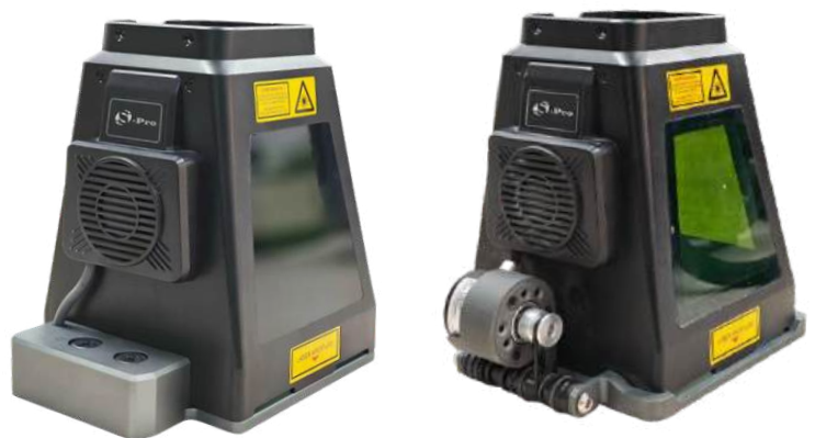
Forlængere til beskyttelseskonus

Takket være den høje hastighed, nøjagtighed og brugervenlige betjening egner en bærbar fiberlaser sig både til professionelle anvendelser og mobile opgaver. Den er den ideelle løsning for alle, der ønsker at lave holdbare og præcise mærkninger direkte på stedet.