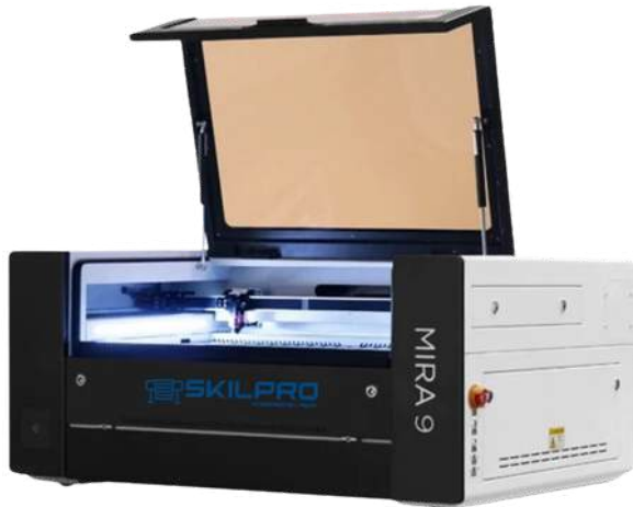
Skilpro Mira 9 Pro 100W CO2 Laserskærer - By Aeon