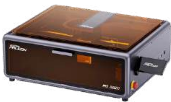
Creality Falcon A1 Pro 20W Laser