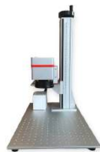
SkilPro 5W UV Galvo Mærknings Laser