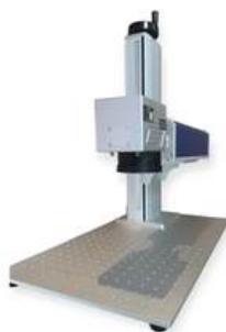
SkilPro 50W Galvo Fiber Laser